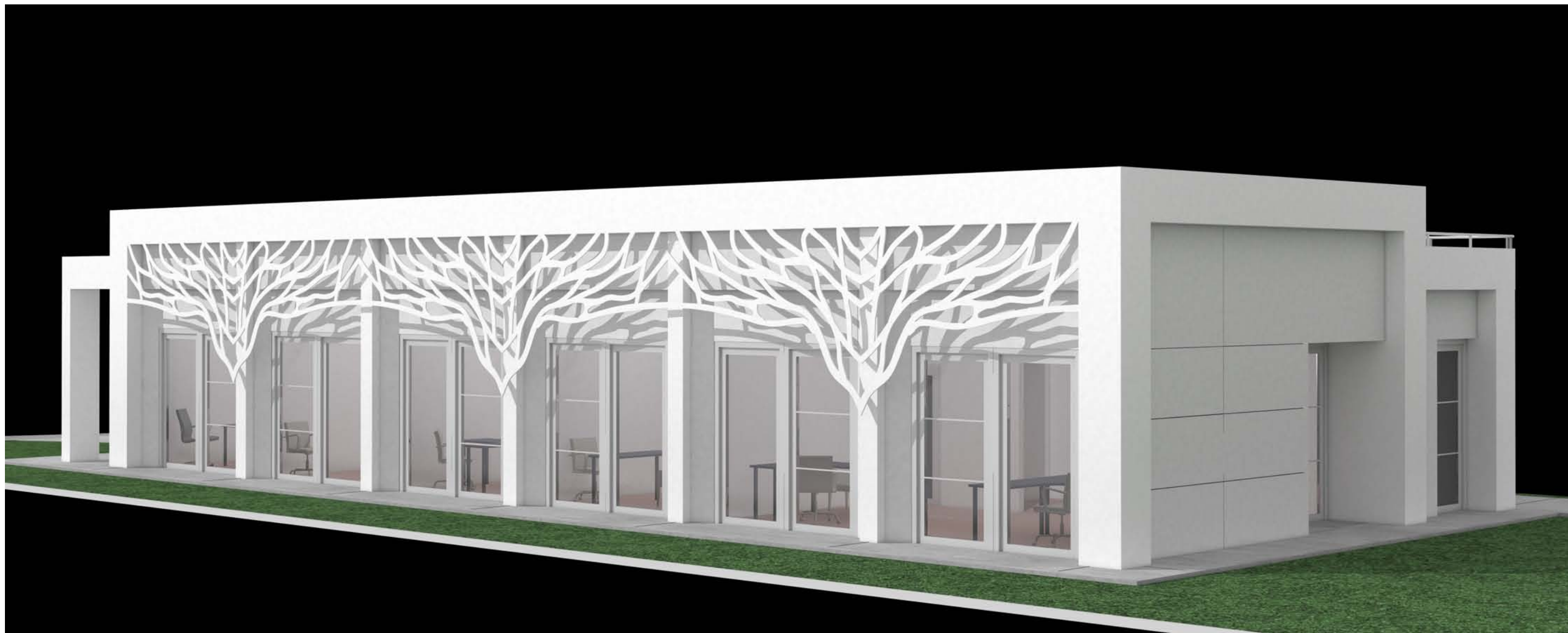
7 - EDIFICIO DI PROGETTO - SIMULAZIONE DEL PROSPETTO NORD-OVEST VERSO IL PERCORSO PEDONALE