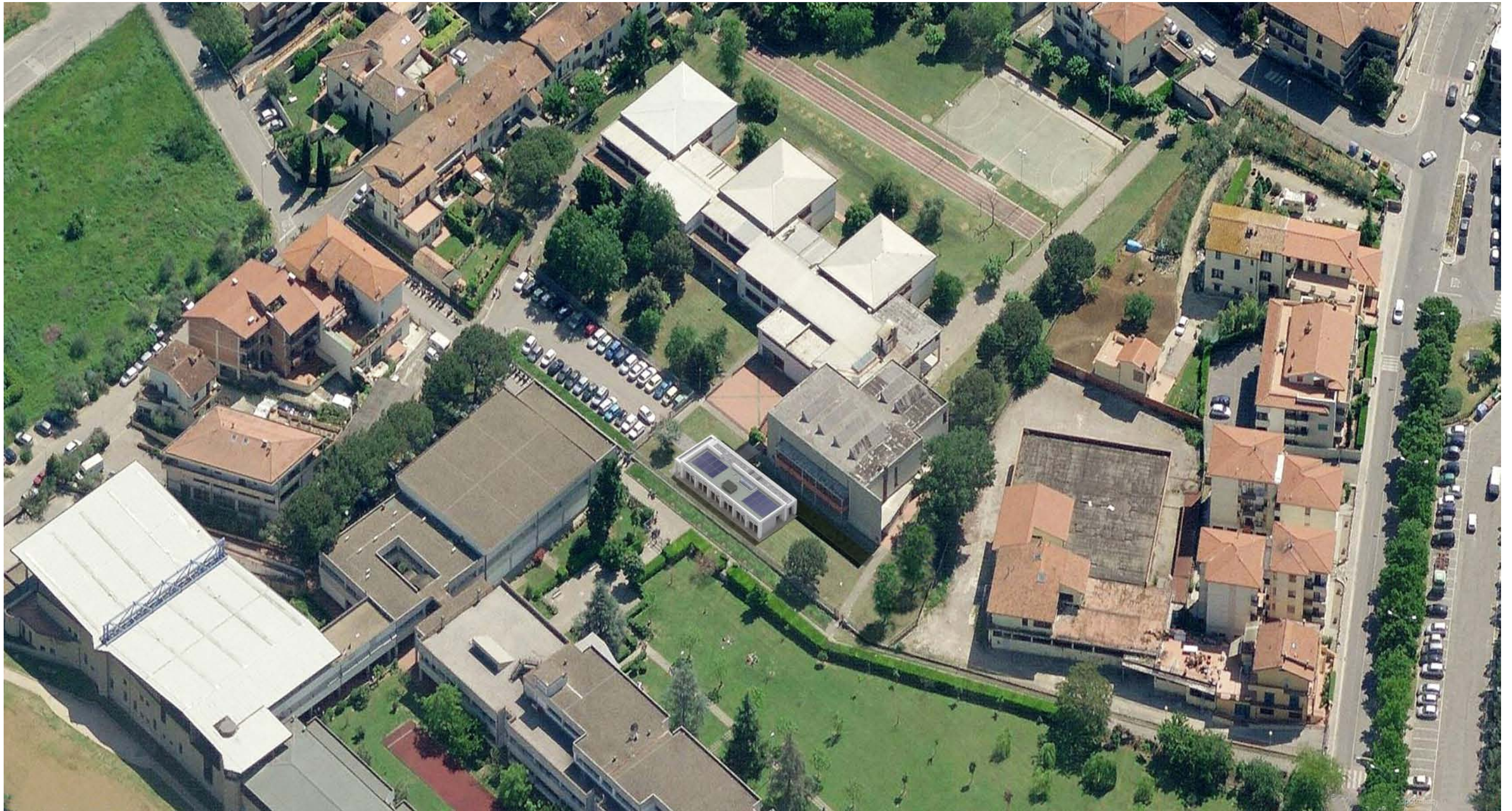
2 - PLANIMETRIA AREA DI INTERVENTO CON INSERIMENTO PROGETTO