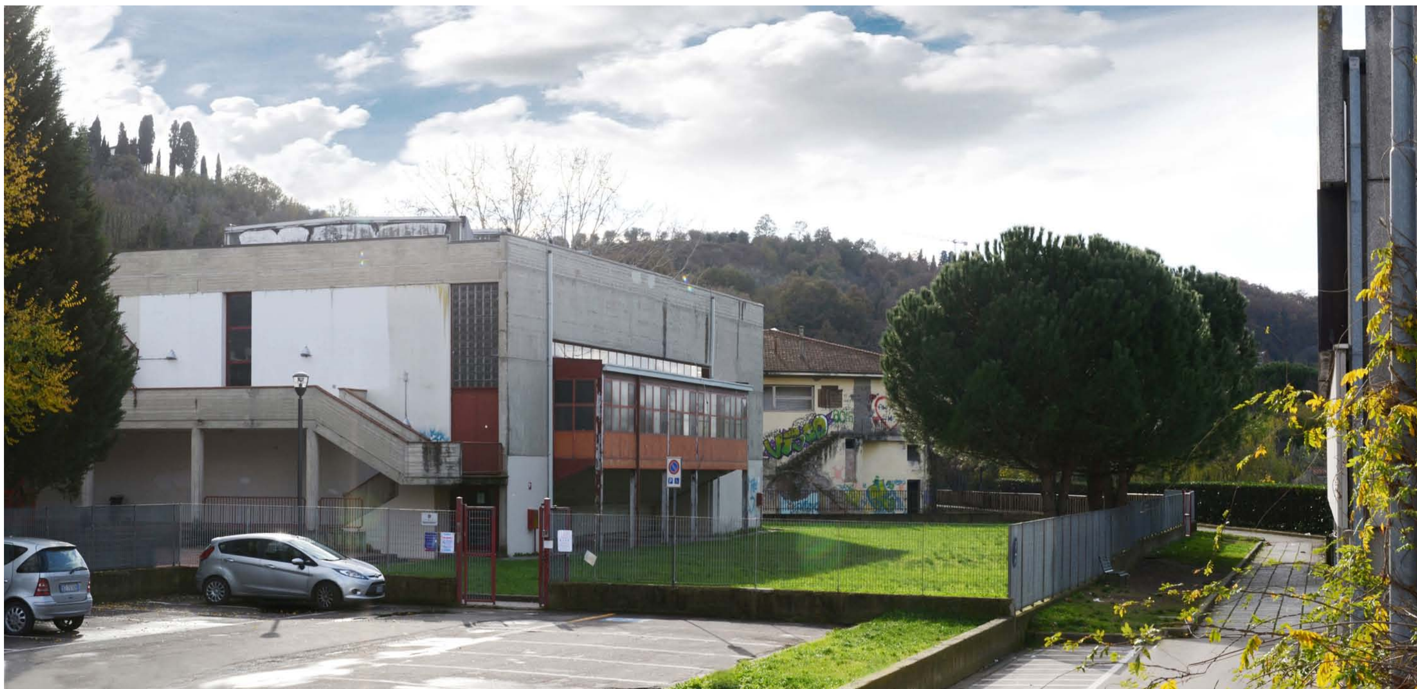
4 – VISTA PROSPETTICA DELL'INGRESSO DELLA SCUOLA DA VIA DEL PARTELLLO ALLO STATO DI FATTO