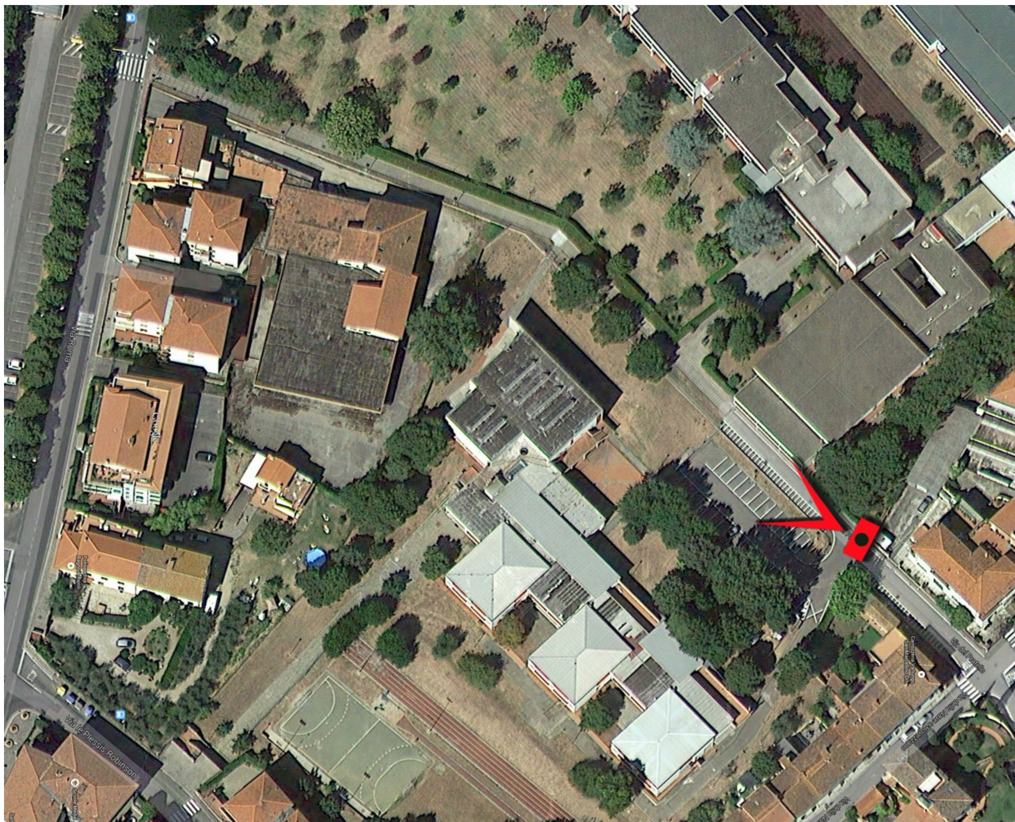
3 - VISTA DEL FOTOINSERIMENTO PROSPETTICO (immagini 4 e 5)