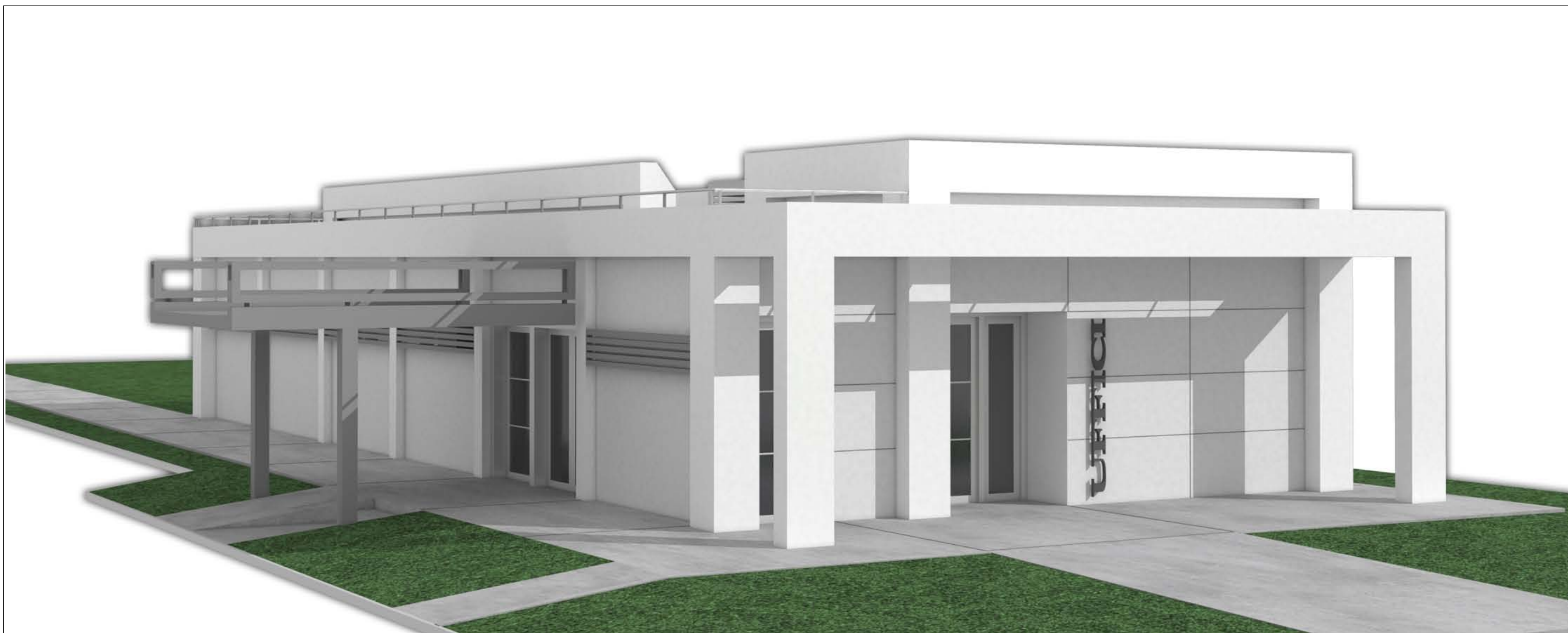
8 – EDIFICIO DI PROGETTO – SIMULAZIONE PROSPETTO NORD-EST E EST-OVEST LATO PORTICO E LATO PENSILINA DI COLLEGAMENTO AL VECCHIO EDIFICIO SCOLASTICO