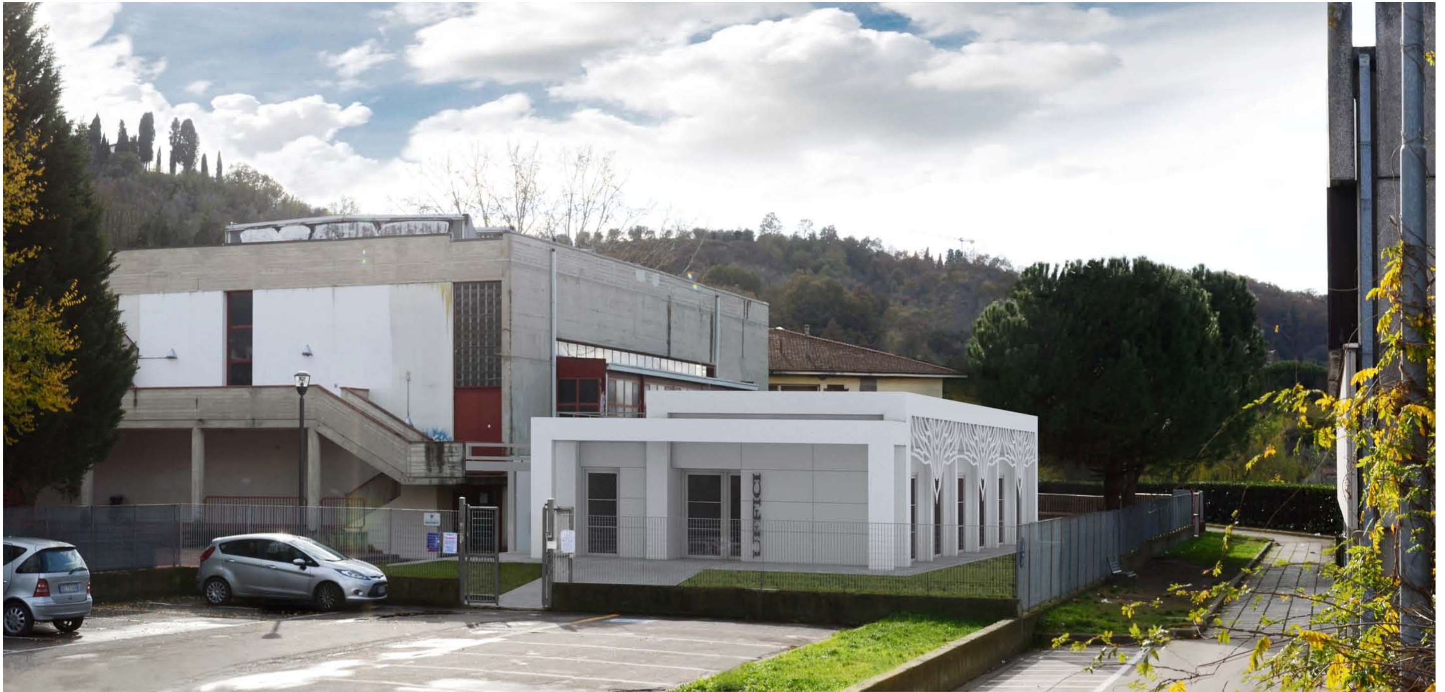
5 – VISTA PROSPETTICA DELL'INGRESSO DA VIA DEL PARTELO CON FOTOINSERIMENTO DEL PROGETTO